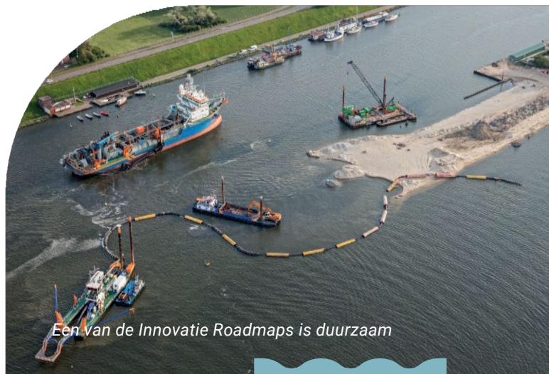
Een van de Innovatie Roadmaps is duurzaam

Dit is een belangrijk programma binnen de Innovatie Roadmaps. Het doel is om meer impact te organiseren met het open en onafhankelijk zakelijk glasvezelnetwerk in de regio en bij te dragen aan de ontwikkeling van digitale oplossingen voor maatschappelijke vraagstukken. Zowel voor de industrie als voor de samenleving.